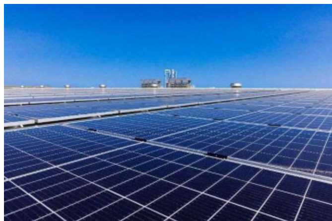
新工場棟に設置した太陽光発電設備

住友林業グループは RE100 に加盟し、2040 年までに事業活動で使用する電力を 100%再生可能エネルギーにすることを目指しています。製造工場が使用する電力はグループ全体の約 66%を占め、RE100 達成に向けて製造工場への再生可能エネルギー導入は不可欠です。住友林業グループは事業活動で生み出す経済的価値に加えて、温室効果ガス排出の抑制や生物多様性保全などの「環境的価値」、労働安全や雇用確保などの「社会的価値」からなる「公益的価値」を高める経営に取り組み、脱炭素社会の実現に貢献していきます。