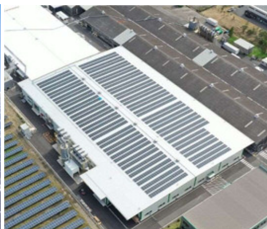
住友林業クレスト鹿島工場新工場棟